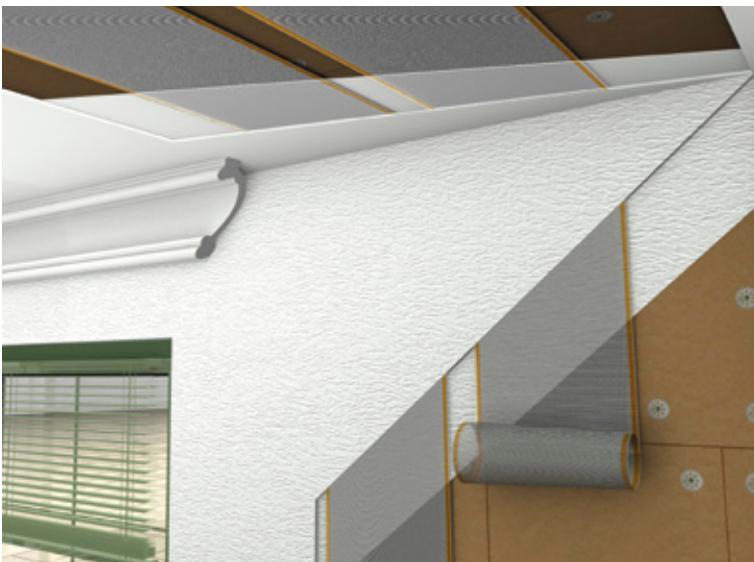
Aufbau des Dämm-Heiz-Systems. Die diffusionsoffene Konstruktion optimiert das Raumklima und verhindert Schimmelbildung.

Die sehr guten Dämmeigenschaften der Dämmelemente „UdiIN 2cm“ beruhen auf „Klimakammern“ – unzähligen Luftschicht-Säulchen, kombiniert mit einer aufkaschierten Holzfaserdämmplatte. Feuchtigkeit wird aufgenommen und abtransportiert, somit Staunässe und Schimmelbildung wirkungsvoll verhindert und das Raumklima positiv beeinflusst. Weitere Pluspunkte des Dämm-Heiz-Systems sind eine geringe Aufbauhöhe von nur 2 cm sowie die einfache Montage. Die Dämmplatte wird nach dem Zuschnitt in einem dünnen Spachtelbett verklebt. Auch die Montage der Carbonbahnen der Direktheizung ist einfach: zuschneiden, einspachteln und verbinden, die Oberfläche abschließend mit Lehm- oder mit Kalkputz veredeln.